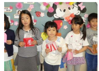
少し緊張しながら自己紹介