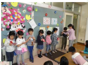
お誕生日 おめでとう