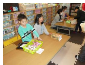
お店屋さんごっこ そよかぜ給食