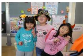
ハロウィン パーティー